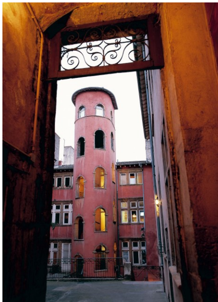
La Maison du Crible dans le Vieux-Lyon

Der Abend steht zur freien Verfügung. Übernachtung im Hotel du Pont Wilson, Lyon.